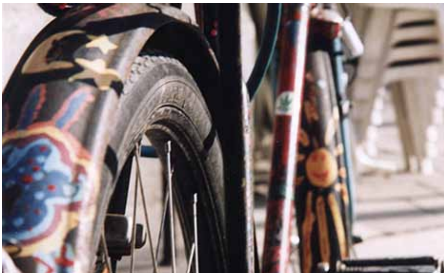
Farbenfroh und frei – das bunt bemalte »Peace Bike« repräsentiert das Lebensgefühl des US-Amerikaners

geben sollen. Als er den schrieb und dabei über seine Karriere sinnierte, dachte er sich: »Warum eigentlich nicht? Es ist möglich!«