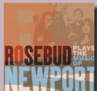
Rosebud plays the Music of Newport