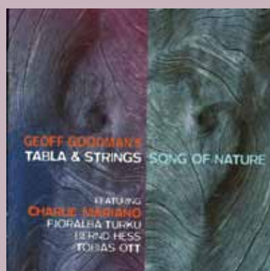
Tabla and Strings – Song of Nature