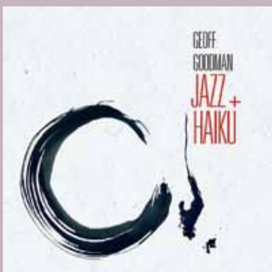
Jazz and Haiku